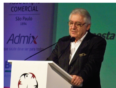
Guilherme Afif Domingos (ministro da Secretaria da Micro e Pequena Empresa)