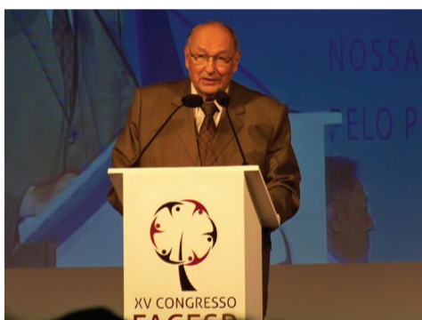
Ives Gandra Martins (advogado tributarista, professor, escritor e jurista)